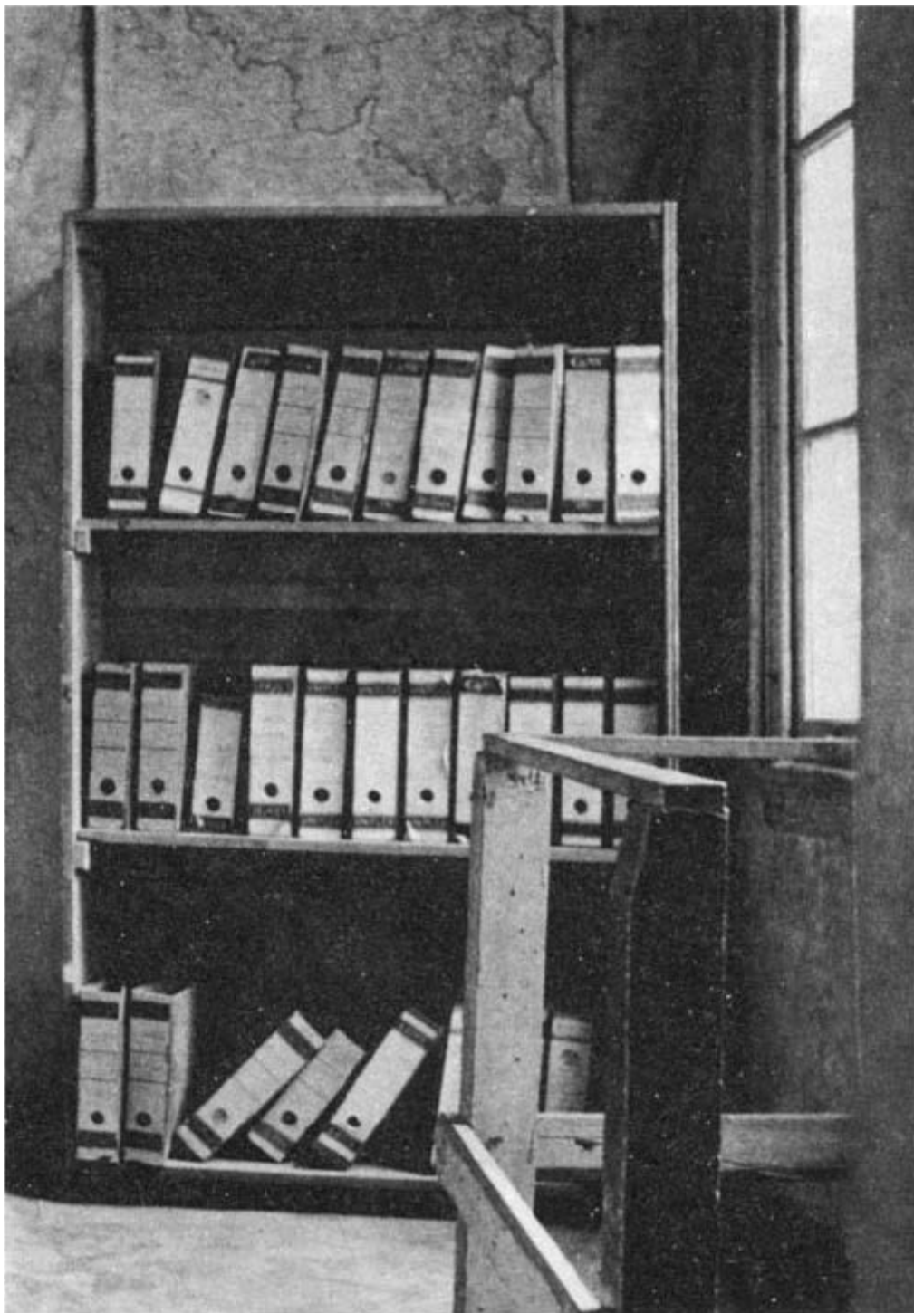
A entrada do Anexo Secreto é disfarçada por uma estante móvel.