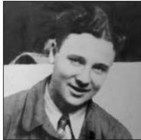
Peter van Pels