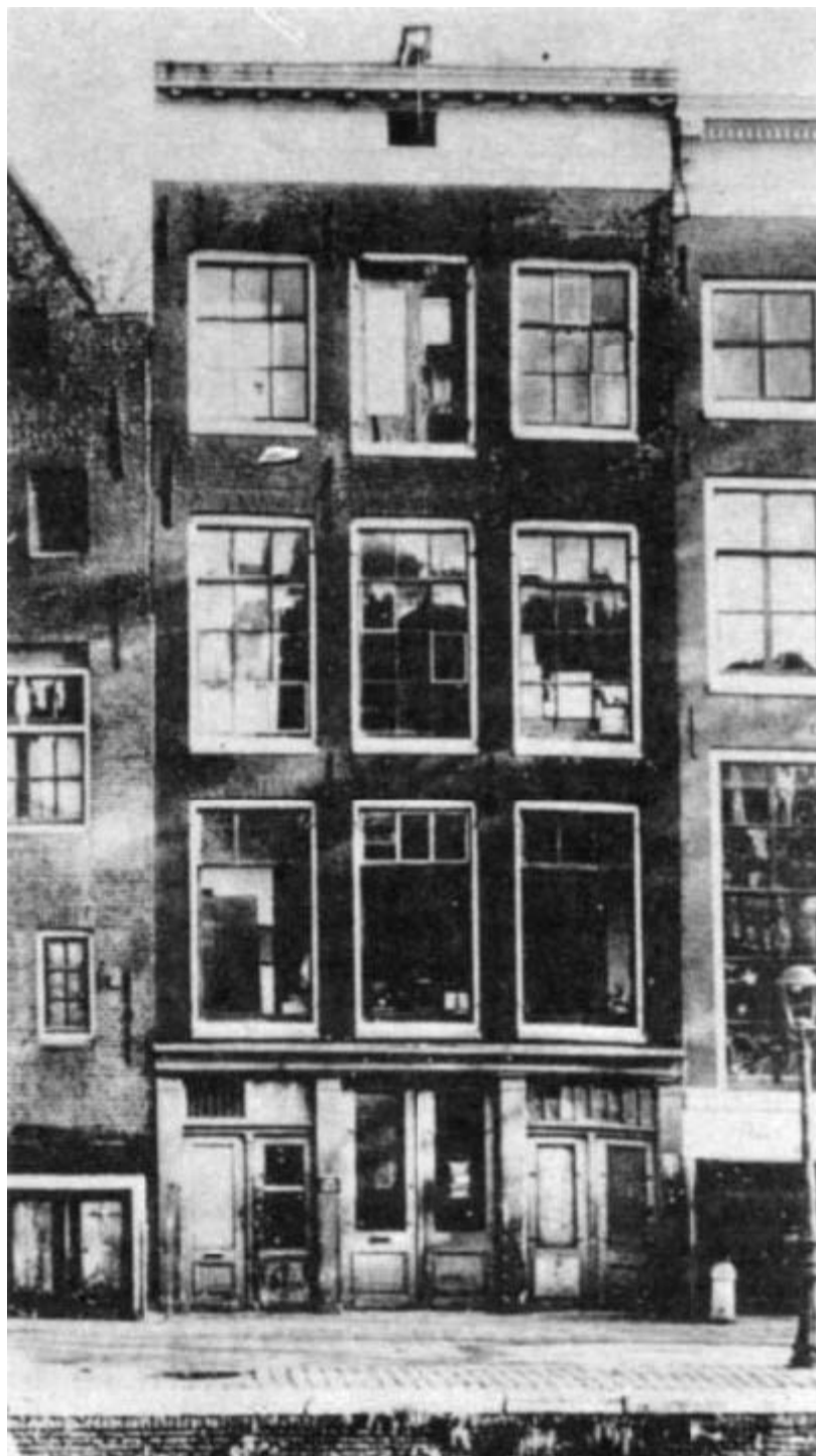
O prédio de escritórios no qual Anne Frank e sua família viveram escondidos de 1942 a 1944.